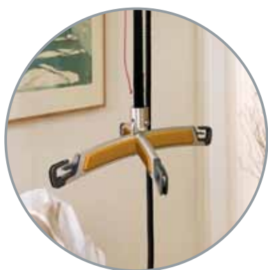
Kryssbøyle Small 50 x 25 cm HMS Art nr. Art.nr. 162718 81563