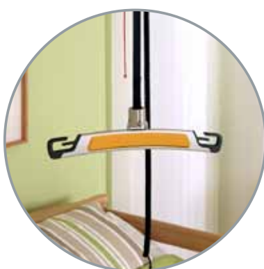
2-punktsbøyle Medium 45 cm bred. Art.nr. Leveres som standard med 81561 Nova 300