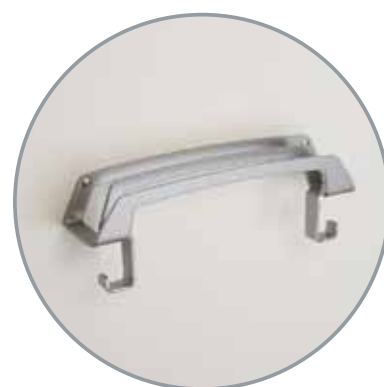
Bøyleholder HMS Art nr. Art.nr. 162720 81568

Kryssbøylene brukes når man ønsker større avstand mellom løfteseilets ben og ryggbånd. Fire kroker gir løftet ekstra stabilitet. Samtidig fordeles vekten over en større flate, noe som bidrar til økt komfort.