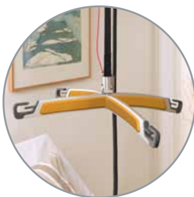
Kryssbøyle Large 50 x 40 cm. HMS Art nr. Art.nr. 162719 81564