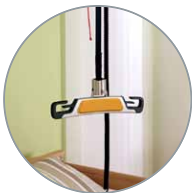
2-punktsbøyle Small, 30 cm bred. HMS Art nr. Art.nr. 162716 81560

Riktig bøyletype gjør ikke bare løftet mer behagelig for brukeren, men gjør det også sikrere og mer stabilt. Bøylens bredde påvirker løftet, og størrelsen må stemme med brukerens skulderbredde, for å oppnå et jevnt og sikkert løft. Hvis brukeren er utrygg kan en smalere bøyle holde løftet mer samlet, og dermed skape større trygghet. Er bøylene for bred for brukeren kan løftet føles ustabil. Nova bøylor er markedets letteste bøylor. De er enkle å håndtere og rengjøre. Alle bøylor har en hurtigkopling som gjør det enkelt å bytte modell. Samtlige bøylor kan benyttes på takløfter, friløfter og mobil personløfter.