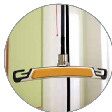
2-punktsbøyle Large 50 cm bred. HMS Art nr. Art.nr. 162717 81562