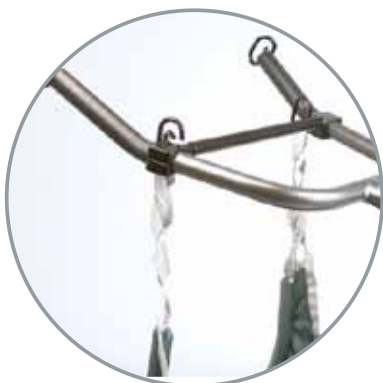
Comfort bøyle til Nova 500