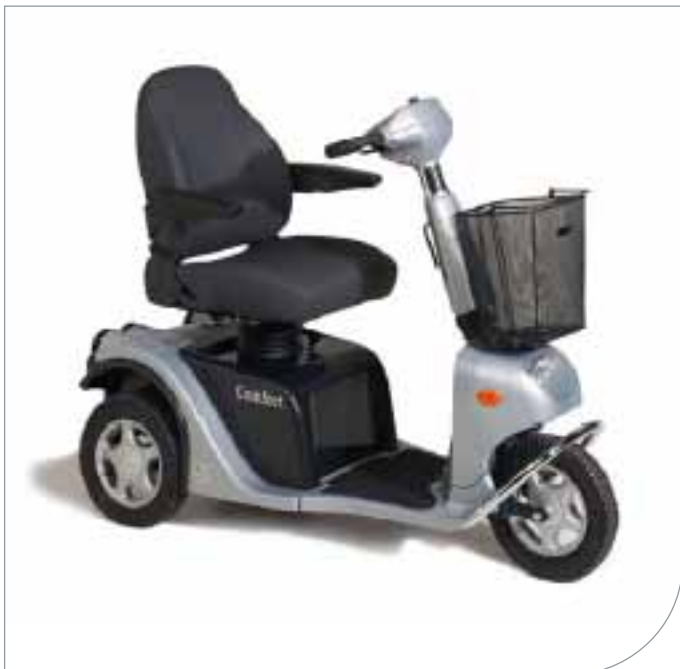
Stratus Revolution 3

Stratus Revolution er en scooter som leveres med det meste av utstyr og finesser, som tidligere har vært ekstrautstyr.