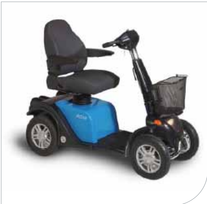
Stratus Revolution 4 (illustrasjonsbilde, leveres med orange deksel)