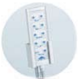
Lett forståelig håndkontroll