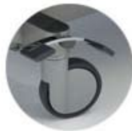
Hjul 150 mm, sentralbrems og retningsperre i høyre fotende