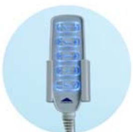
Håndkontroll med lys (må oppgis ved bestilling)