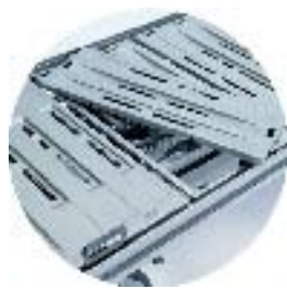
Avtagbare, rengjøringsvennlige ABS-plater