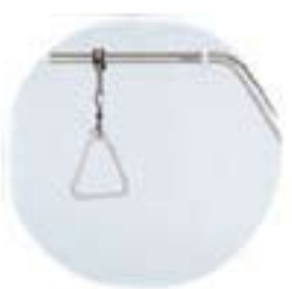
Løftebøyle med trapes art.nr. ST140313