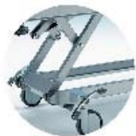
Sakseløft og glatte flater