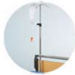
Infusjonsstativ, rett art.nr. ST116264 Infusjonsstativ, vinklet art.nr. ST141394