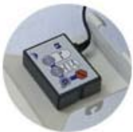
Betjeningspanel i fotenden ACC