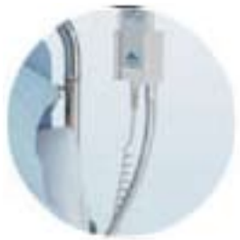
Holder for håndkontroll art.nr. ST183273