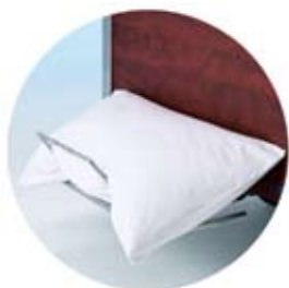
Uttrekkelig hylle ved fotenden til f.eks. sengetøy