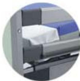
Integrert sengeforlenger på 20cm