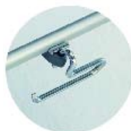
Universalbøyle art.nr. ST116263