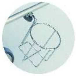
Urinflaskeholder art.nr. ST104693