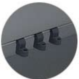
Integrert oppheng for universalbøyle begge sider