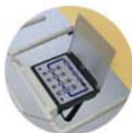
Betjeningspanel i fotenden ACU (må oppgis ved bestilling)