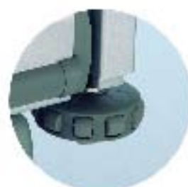
Avviserhjul, horisontale og vertikale (må oppgis ved bestilling)