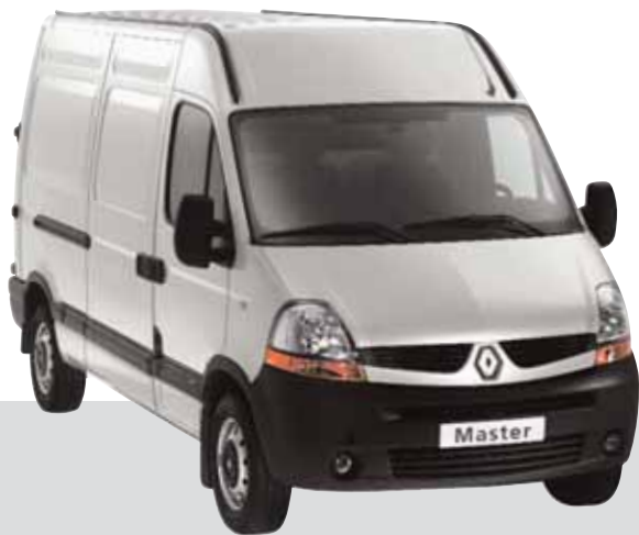
Basismodell fra Renault

Vi kan gi deg noen eksempler. Eller vi kan tilby en tilpasset innredning for deg.