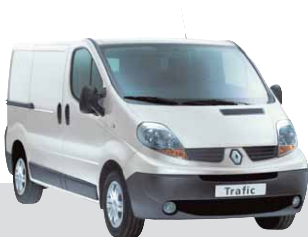
Basismodell fra Renault

Det perfekte modulsystem for alle behov og ergonomisk arbeid.